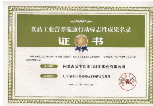
“UHT 再制干酪关键技术的研究与开发” 列入“食品工业营养健康行动标志性成果”名录